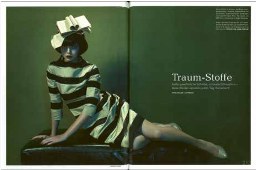
[Abb. 8] »Traum-Stoffe«: Kleid von Giambattista Valli (Doppelseite aus: Madame 10/2008, S. 212f.)

werden. Die im Titel zitierten ›bleibenden Werte‹ sollen sich in der edlen Bildsprache wechselseitig ergänzen: das intellektuelle, buchstäblich ›gute Buch‹ mit literarischem Anspruch und die ökonomischen Güter wie Uhren und Schmuck als Ausweis repräsentativen Lebensstils. Das Kulturgut Buch leiht seine Aura dem materialistischen Luxuskonsum.