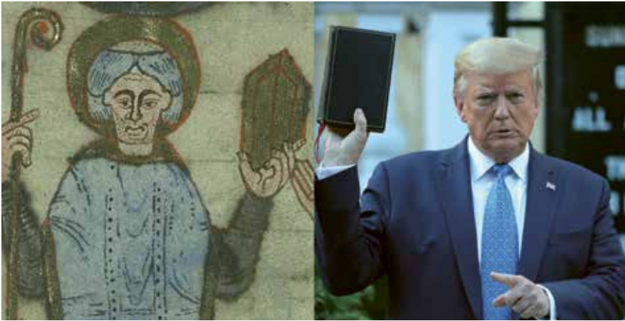
[Abb. 4] Der hl. Bertin (links) und Donald Trump (rechts). Ausschnitte aus Abb. 1 u. 5

kirchlichen Amtes erhält. 47 In Darstellungen der kirchlichen Ämterhierarchie, wie sie etwa im Sakramentar des Raganaldus aus dem 9. Jahrhundert überliefert sind, werden die Instrumente des Amtes mit erhobenen Armen vorgezeigt, ganz ähnlich wie dies in unserer Miniatur der Fall ist. 48 Bischofsstab und eine päpstlich verliehene Dalmatika (das Kleid des Diakons während der Messe) waren besondere Auszeichnungen der Äbte von Saint-Bertin, die ihre den Bischöfen gleiche – ja in unserem Bild überlegene – Gewalt sakramentaler Heilungsvermittlung symbolisierten. 49 Das erhobene Buch schließt sich diesen Instrumenten an. Unterhalb des Lamms kann es nur das ebenso vom Diakon wie vom Bischof bei der Messe gebrauchte Evangelienbuch meinen, »den gegenwärtigen Leib des sichtbaren Wortes« wie es Isaak von Stella im 12. Jahrhundert bezeichnend formuliert. 50 Die Amtsgewalt des heiligen Abts leitet sich in unserem Bild von seiner Mittlerfunktion beim sakramentalen Gebrauch Buchs ab, bei der das Buch zum »symbolon« des Corpus Christi wurde. »Logos«, »pathos« und »ethos« sind hier in eigentümlicher Weise verbunden: der »logos« (das Wort) ist zum Körper geworden, sodass die Buchstaben des Texts hinter der den Körper des Buchs kleidenden goldenen Oberfläche verschwinden. Im Motiv der Öffnung des Buchs bleibt diese Verwandlung des Logos zum Körper freilich an das Pathos der rituellen Per-