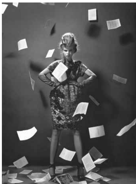
[Abb. 7] »Traum-Stoffe«: Kleid von Lanvin

den Szenen sind geläufige Handhabungen von Buchkörpern zu sehen: Daumen im Buch, Umklammern des Buchs mit beiden Händen, Buch auf der Hüfte oder aufgeschlagenes Buch in den Händen. Das doppelseitige Eröffnungsbild (Abb. 8) verwandelt ein Buch in eine exzentrische Kopfbedeckung und nähert sich damit künstlerischen Arbeiten am Buchkörpern. Diese Modestrecke zeigt nicht, wie sonst üblich, beliebige Bücher mit ebenso offenen Buchzuschreibungen, sondern inszeniert literarische Anspielungen in Bildern fern des Alltags.