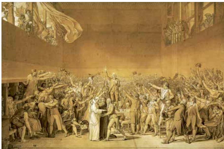
[Abb. 4] Jacques Louis Davis: Ballhauschwur , 1791; lavierte Federzeichnung auf Papier, 65 × 101 cm (Versailles, Château de Versailles, Collections, Inv. Dess. 736)

wenige Jahre zurückliegende Eroberung Englands durch die Normannen, zum Thema hat, geht es hier um eine Schwurpraxis, die den Betrachtenden aus der eigenen Gegenwart vertraut war: Das ›sacramentum‹ des Eids, von dem in der Beischrift die Rede ist, wird durch körperliche Berührung einer heiligen Person vollzogen, die die Einhaltung des Versprechens überwachen soll. Im Akt der Berührung wird das Verständnis des Eids als ›Bindung‹ deutlich: Der Eidleistende setzt die Heiligen, deren Überreste in den Reliquiaren aufbewahrt werden, als Richter über die Einhaltung des Versprechens ein. Im Fall von Harold scheint es sich um einen Eid zu handeln, der später gebrochen wird: Nach seiner Rückkehr nach England nimmt Harold die englische Königskrone an und handelt damit gegen seine Zusage, William zu unterstützen. Seine militärische Niederlage und der Tod bei der Schlacht von Hastings sind damit schon vorgezeichnet.