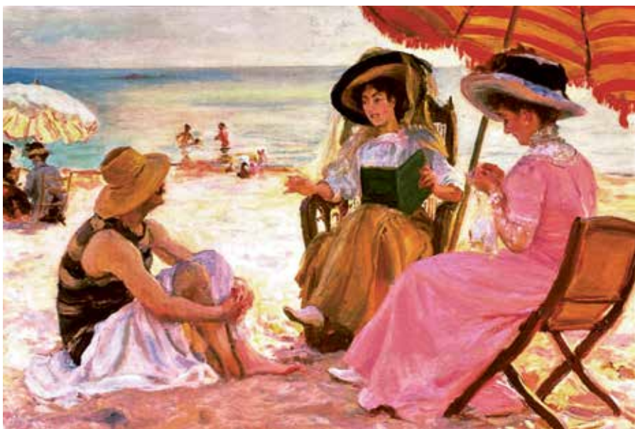
[Abb. 3] Alfred Victor Fournier: Der Strand , 1929; Postkarte (Sagro-Verlag)

länger in der Sommerfrische als die Herren und wurden daher öfter gemalt. Der französische Historiker Alain Corbin zieht in seiner Kulturgeschichte der ›Meereslust‹ auch literarische Quellen heran und zitiert für die ›Erfindung des Strandes‹ aus einer Erzählung von Charles Dickens aus dem Jahr 1836 ein Strandbild, das die geschlechts- und generationenspezifischen Vergnügungen am Strand vorstellt: »Die Damen waren mit Näharbeiten oder Wachehalten oder Stricken oder Romanlesen beschäftigt; die Herren lasen Zeitung und Zeitschriften, die Kinder gruben mit Holzspaten Löcher in den Sand und fingen darin Wasser auf [...].« 8 Die Handarbeiten der Damen finden sich beispielsweise auch in der Lesergruppe von Fournier (Abb. 3).