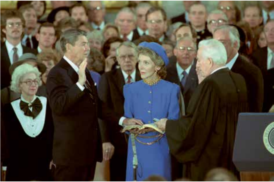
[Abb. 5] Ronald Reagan legt seinen Amtseid auf die Bibel der Familie Reagan ab, 21. Januar 1985; Washington D.C., Rotunde des Kapitols

verstärken würden. Es geht um einen Akt der Selbstermächtigung der verfassungsgebenden Versammlung, der sich nicht auf bereits vorhandene Symbole abstützen soll. Damit wäre der Eid 1792/93 auf dem Niveau einer lediglich gestisch gestützten Sprechhandlung angekommen.